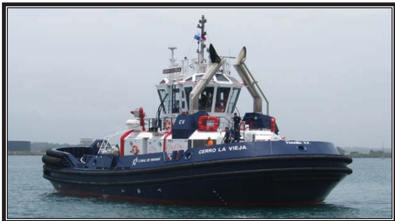
CERRO LA VIEJA